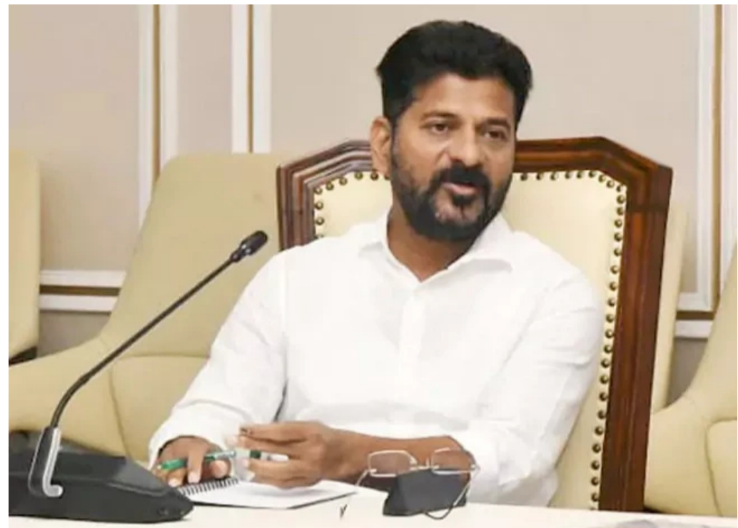
చేయాలని రేవంత్ రెడ్డి ఆదేశించారు. ఒక్కో అసెంబ్లీ నియోజకవర్గంలో ఒక గ్రామం, ఒక పట్టణం చొప్పున మొత్తం 119 నియోజకవర్గాల్లో 238 ప్రాంతాల్లో క్షేత్రస్థాయి పరిశీలన చేపట్టాలన్నారు. పైలట్ ప్రాజెక్టు అనంతరం పూర్తి నివేదిక ఇవ్వాలన్నారు. కుటుంబ సభ్యుల మార్పులు, చేర్పుల విషయంలో జాగ్రత్తలు తీసుకోవాలన్నారు.

- ఫ్యామిలీ డిజిటల్ కార్డుల పంపిణీకి సంబంధించి సీఎం రేవంత్ రెడ్డి కీలక ఆదేశాలు డిజిటల్ కార్డులపై - అధికారులతో సీఎం సమీక్ష 238 ప్రాంతాల్లో క్షేత్రస్థాయి పరిశీలన చేపట్టాలని సూచన హైదరాబాద్: ఫ్యామిలీ డిజిటల్ కార్డుల పంపిణీకి సంబంధించి ముఖ్యమంత్రి రేవంత్ రెడ్డి అధికారులకు కీలక ఆదేశాలు జారీ చేశారు. ఫ్యామిలీ డిజిటల్ కార్డులపై సంబంధిత అధికారులతో ఆయన సమీక్ష నిర్వహించారు. ఈ సందర్భంగా మాట్లాడుతూ... కార్డుల పంపిణీ సమయంలో కుటుంబ సభ్యులు అంగీకరిస్తేనే కుటుంబం ఫౌంటేన్ తీయాలన్నారు. ప్రభుత్వ రికార్డుల ప్రకారం గుర్తించిన కుటుంబాన్ని నిర్ధారించాలని సూచించారు. డిజిటల్ కార్డుల కోసం సేకరించే వివరాలను అధికారులు... ముఖ్యమంత్రి దృష్టికి తీసుకెళ్లారు. అక్టోబర్ 3 నుంచి 7 వరకు పైలట్ ప్రాజెక్టులో భాగంగా క్షేత్రస్థాయి పరిశీలన