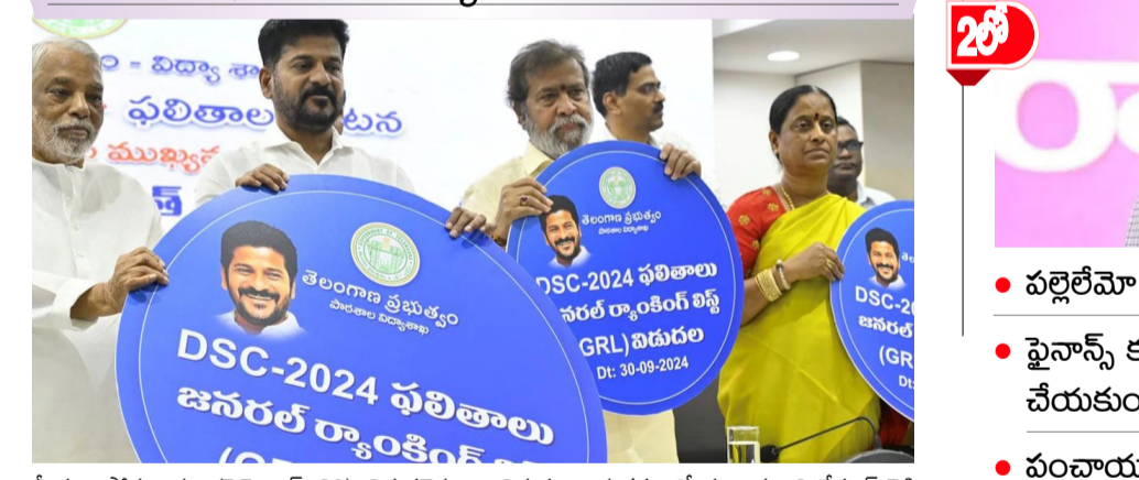
మీదగా సోమవారం (సెప్టెంబర్ 30) విడుదలైన సంగతి తెలిసిందే. డీఎస్సీ-2024 ఫలితాల మాట్లాడుతూ.. మిగతా..2లో

65 రోజుల్లో 11062 ఉద్యోగాల నియామకాలు పూర్తి