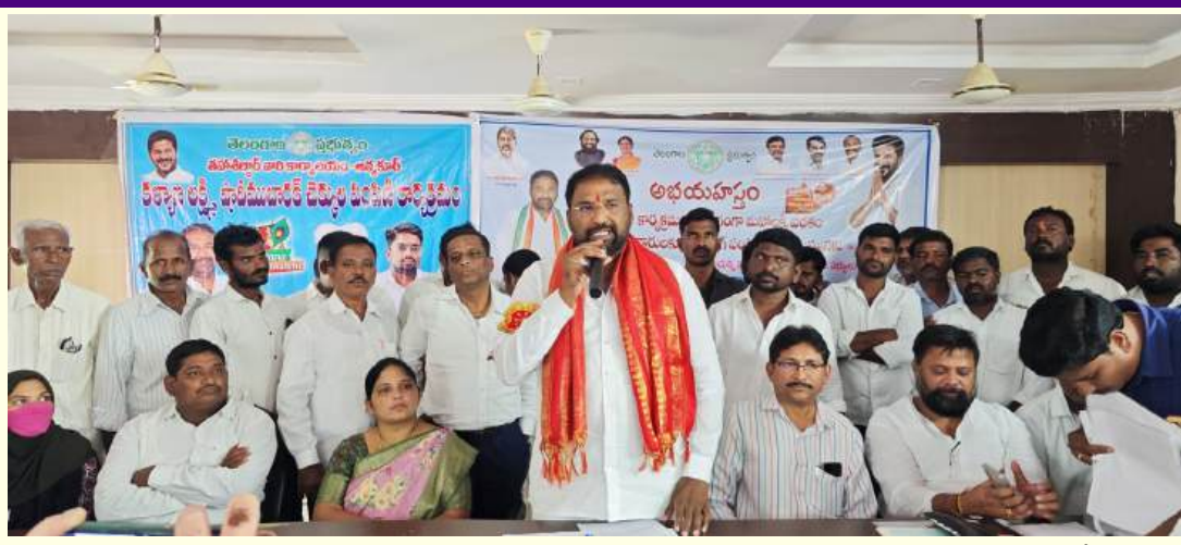
అత్యుక్తారులు, రూపాయలు 500 గ్యాస్ సిలిండర్ ప్రోసీడింగ్ పత్రాలను పంపిణీ అందులో భాగంగా రూపాయలు రెండు లక్షల రుణమాఫీ పథకాన్ని తీసుకువచ్చి రావడం జరిగిందని అన్నారు. అత్యుక్తారు మండలంలో 4175 మంది రైతులకు రూపాయలు 36 కోట్ల రుణమాఫీ