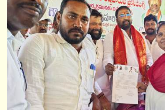
మండలంలోని బాలకృష్ణపూర్ గ్రామంలో, అలాగే అత్యుక్తారులోని ఎంపీడివో కార్యాలయంలో 32 మంది కళ్యాణ లక్ష్మి షాదీ మూరార్క లబ్ధిదారులకు చెక్కులను పంపిణీ చేశారు. అలాగే 3,447 మంది