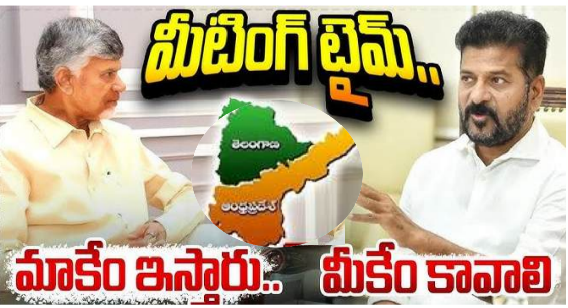
హైదరాబాద్ : ఇటీవల సుప్రీంకోర్టు వర్గీకరణ చేయాల్సిన అవసరం నమయం రాష్ట్రాలకు స్వేచ్ఛను ఇస్తా.. సుప్రీంకోర్టు ఇచ్చిన తీర్పును అనుకూలంగా ఏపీ వర్గీకరణ చేయాల్సిన అవసరం నమయం నిర్ణయించిన విషయం తెలిసిందే. ఏగతా..2లో

ఎలా వర్గీకరించాలన్న విషయం పై ఏపీ సీఎం చంద్రబాబు ఒక నిర్ణయానికి వచ్చారు ఎవరికీ ఇబ్బందులు లేకుండా.. వ్యవహరించాలన్న ఉద్దేశంతో ఈ నిర్ణయం తీసుకున్నారు ఈ నేపథ్యంలో తాజాగా సీఎం రేవంత్ రెడ్డి కమిటీని ఏర్పాటు చేశారు రాష్ట్రాన్ని యూనిట్ గా తీసుకుని వర్గీకరణ చేయాలని భావిస్తున్నారు