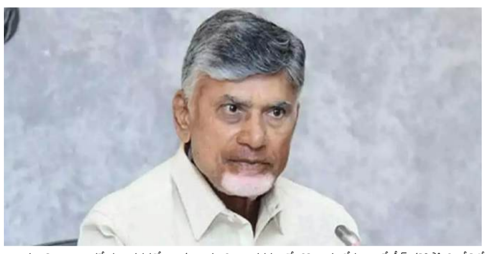
అమరాతి : బుడమేరు వరదతో లక్షల మంది నిరాశ్రయులయ్యారు. ఇప్పుడు ఏలేరు రిజర్వాయర్ కు పోటెత్తిన వరద లతో 62 గ్రామాల్లోనూ అంతే సీన్ కనిపిస్తోంది. దీనిలో హిరాపురం నియోజకవర్గం కూడా ఉండడం గమనార్హం.