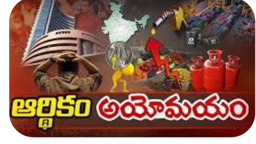
ధిల్లీ : అమెరికాలో పెరిగిపోతున్న ఆర్థిక మాంద్యం భయాలు, మరోవైపు తూర్పు ఆసియాలో కమ్ముకున్న యుద్ధ మేఘాలు