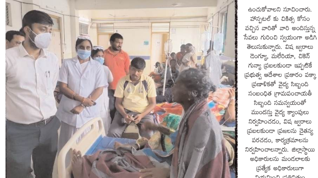
సీజనల్ వ్యాధులు వస్తున్న నేపథ్యంలో మందులు సిద్ధంగా పర్యవేక్షించడం జరుగుతుందని కలెక్టర్ తెలిపారు.

గూడూరు (గౌతమ్ స్టూన్): ప్రభుత్వ గిరిజన ఆశ్రమ పాఠశాలలు బాలికలు, బాలుల వసతి గృహాలను, ప్రభుత్వ జూనియర్ కళాశాలలను తనిఖీ చేసి పిల్లలతో స్నేహంగా మాట్లాడుతూ వారికి అందిస్తున్న ఆహారం పసతులు తదితర సౌకర్యాల గురించి ఆడిగి తెలుసుకున్నారు. వసతి గృహంలో షేడ్ రూమ్, డైనింగ్ హాల్, వసతి గదిని, మరుగుదొడ్డు, లును తనిఖీ చేశారు. పిల్లలకు అలాగే సమస్యలు రాకుండా తీసుకుంటున్న చర్యలు ఫీవర్ సర్వే, షెడ్యూలు ప్రకారం మెడికల్ క్యాంపులు ఏర్పాటు చేయాలని సిద్ధమైందని ఆదేశించారు. వసతి గృహంలో పరిసరాల పరిశుభ్రంగా ఉంచుకుంటే ఎలాంటి సీజనల్ వ్యాధులు రాకుండా జాగ్రత్త పడవచ్చని తెలిపారు. విద్యార్థిని, విద్యార్థులకు ఆహారకరకరమైన వాతావరణంలో విద్యాభ్యాసం అందించాలన్నారు. అనంతరం కమ్యూనిటీ హెల్త్ సెంటర్ ను తనిఖీ చేసి బెడ్ పేషెంట్, ఇన్ పేషెంట్ వివరాలు తెలుసుకున్నారు. సీజనల్ వ్యాధులు ప్రజలకుండా తీసుకుంటున్న చర్యలు జ్వరాల సమాధుల వివరాలు రిజిస్ట్రేషన్ తనిఖీ చేశారు. మండల స్టాక్ వివరాలను తనిఖీ చేసి