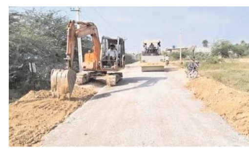
బీటీ రోడ్డు నిర్మాణం పనులు చేపట్టాలని ప్రజల డిమాండ్ చేస్తున్నారు. నియోజకవర్గంలోని అతిపెద్ద గ్రామంలో అవతరించిన కల్సుకోలో గ్రామం సువికలాంగా అన్ని వనతులతో ప్రజలకు వ్యాపార పరంగా చుట్టూ గ్రామాల ప్రజలకు కూడా ఈ గ్రామం ఒక వ్యాపార

ప్రాంతంగా వెలిసింది. గత ప్రభుత్వం మండల కేంద్రం చేస్తామని ఎన్నికల ముందు ఓట్ల కోసం హైదరాబాద్ చేసి ఆ తర్వాత ప్రభుత్వం రాకపోవడంతో మండల కేంద్రం మాట మర్చిపోయారు, కనీసం ఇటీవల నూతనంగా ఏర్పడ్డ కాంగ్రెస్ ప్రభుత్వం కల్సుకోలో గ్రామాన్ని మండల కేంద్రం చేయాలని డిమాండ్ చేసినప్పటికీ కొల్లూపూర్ శాసనసభ ఎన్నికల్లో కాంగ్రెస్ పార్టీ ప్రవేశ మంత్రి జూపల్లి కృష్ణారావుకు కల్సుకోలో గ్రామంలో మెజార్టీ రాకపోవడం వల్ల మండల కేంద్రంపాటు కల్సుకోలో గ్రామంలో వివిధ అభివృద్ధి పనులకు విధులు కేటాయించాలనే మంత్రి ఆసక్తి చూపడం లేదని ఆ గ్రామ ప్రజల ద్వారా తెలుస్తుంది. గత ఎన్నికల్లో ఎప్పుడు చూసినా కాంగ్రెస్ పార్టీకి మెజార్టీ రాకుండా భారతీయ జనతా పార్టీకి అఖండ మెజార్టీ ఆ గ్రామం ప్రజలు కట్టబెట్టడం వల్ల అధికారంలో ఉన్న కాంగ్రెస్ గ్రామ అభివృద్ధి పట్టి వివక్షత చూచిస్తుంది ఆ గ్రామ ప్రజలు అంటున్నారు. ఇప్పటికైనా కల్సుకోలో గ్రామం అభివృద్ధి కోసం ప్రధానంగా బీటీ రోడ్డు నిర్మాణం కోసం ప్రధానమంత్రి గ్రామ సడక్