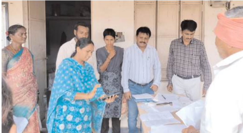
టేకులపల్లి (గౌతమ్ న్యూస్): రుణమాఫీ లో కుటుంబ సభ్యుల నిర్ధారణ కార్యక్రమం లో భాగంగా