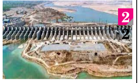
వివాదు జస్టిస్ సీని చంద్రశేఖర్ కమిషన్ విచారణ కొనసాగుతోంది. మేడిగడ్ ప్రాజెక్టు కుంగుటాటుకు కారణం రాష్ట్ర కింద పలు సమస్యల వల్ల జరిగింది అన్నట్లు కమిషన్ ముందు ఇంజనీర్లు చెప్పారు.

డీజైన్ల అప్రూవల్ తర్వాత అన్యాయంగా మోడిఫికేషన్ జరిగిందని కమిషన్ముందు ఇంజనీర్ ఒప్పణున్నారని అన్యాయం సుందర్ బాల్ కేసులో లోకేశ్ మాంసింగ్ కమిషన్ కు అధికారులు చెప్పారు డీజైన్లో ఎలాంటి సమస్య లేదని నిబంధనల ప్రకారమే డీజైన్లు ఉన్నాయని ఇంజనీర్లు వెల్లడి