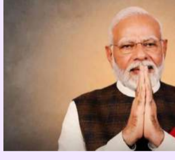
ధీర్ఘ : ప్రధాని నరేంద్ర మోదీ నేడు ఆశాశ్రవాణి (రేడియో)లో 'మన్ కీ బాత్' ప్రసంగం వినిపించారు. వివరాలు 2లో..

ప్రధాని మోదీ మన్ కీ బాత్ ప్రసంగం హైలెట్స్ ఆగస్టు 29న తెలుగు భాష దినోత్సవం మన్ కీ బాత్ ప్రసంగంలో ప్రస్తావించిన ప్రధాని మోదీ