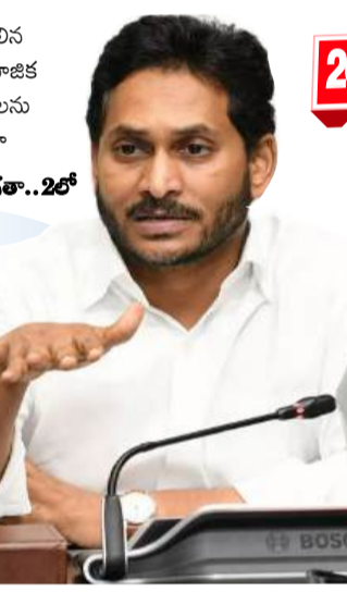
మిగిలిన సామాజిక వర్గాలను కూడా విగత..26