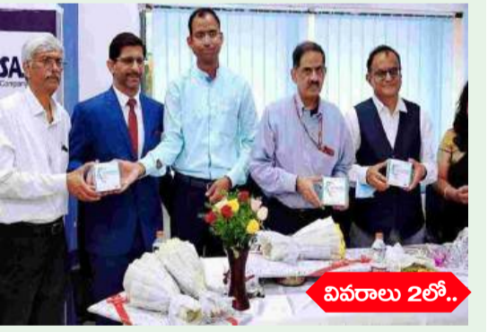
అమరావతి: విశాఖ మెడ్ బెక్ జోన్ మరో ఘనతను సాధించింది. కరోనా సమయంలో ఆరోగ్య విగత..26