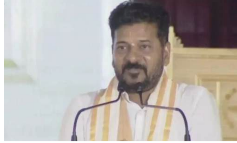
హైదరాబాద్ : తెలంగాణ రాష్ట్రం ఏర్పాటు సాహసించని విధంగా తెలంగాణా ముఖ్యమంత్రి రేవంత్ రెడ్డి అత్యంత విగత..26