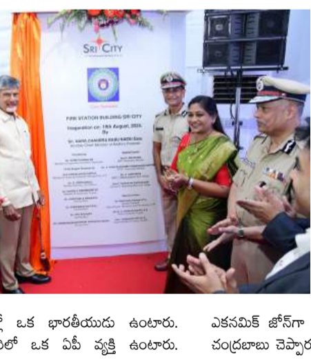
నలుగురు ఐటీ నిపుణుల్లో ఒక భారతీయుడు ఉంటారు. ఇందులోని ప్రతి నలుగురిలో ఒక ఏపీ వ్యక్తి ఉంటారు. విగ్రా..28

చంద్రబాబు శ్రీసిటీ సందర్శన! శ్రీసిటీ : ఆంధ్రప్రదేశ్ ముఖ్యమంత్రి చంద్రబాబు నాయుడు సోమవారం నాడు నూతనంగా పేట దగ్గర వున్న శ్రీసిటీ పారిశ్రామిక ప్రాంతాన్ని సందర్శించారు. శ్రీసిటీలోని బీజినెస్ సెంటర్లో పలు కంపెనీల సీఈఓలతో నిర్వహించిన సమావేశంలో చంద్రబాబు మాట్లాడారు. పరిశ్రమల ద్వారా ప్రభుత్వానికి ఆదాయం సమకూరుతుందని, ఈ సంపద సర్వీసులను దోహదం చేస్తుందని చెప్పారు. పారిశ్రామికవేత్తలు ఉపాధి, సంపద సృష్టిస్తున్నారని సీఎం చంద్రబాబు తెలిపారు. "అప్పటి ప్రధాని పీవీ నరసింహారావు చొరవతో 1991లో దేశంలో ఆర్థిక సంస్కరణలు మొదలయ్యాయి. పెట్టుబడులు రాబట్టేందుకు పలు దేశాల్లో పర్యటించాను. ఐటీ పరిశ్రమ భారతదేశాన్ని ప్రపంచ పటంలో నిలుపుతుందని ఆనాడే చెప్పాను. గతంలో ప్రైవేట్ పబ్లిక్ పార్టనర్షిప్ విధానంలో హైటెక్ సీటీ చేపట్టాను. ప్రపంచంలో ప్రతి