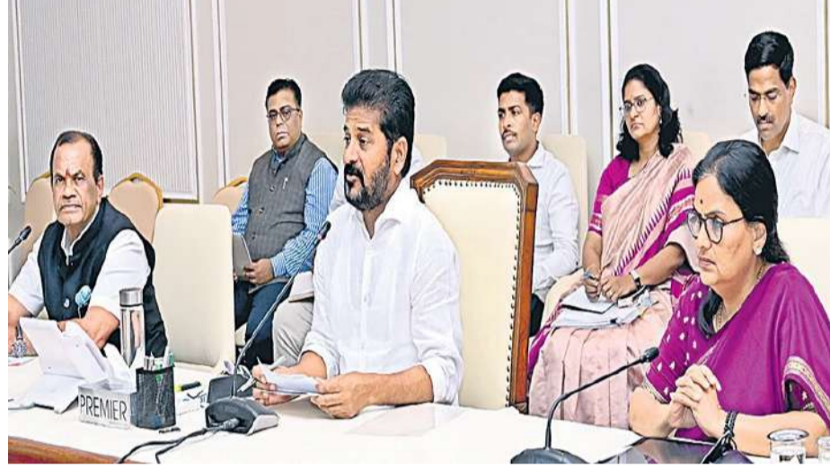
హైదరాబాద్: 'ఎన్నికల కోడ్ కారణంగా వంద రోజులు ప్రభుత్వ కార్యక్రమాలు, పనులు నిలిచిపోయాయి. ఇకపై ఉన్నతాధికారులు విధిగా పరిపాలనపైనే దృష్టి సారించాలి. ప్రజలకు సువరిపాలనను అందించేందుకు క్రమశిక్షణ పాటించాలి. ప్రజా ప్రయోజనాలకు ప్రాధాన్యం ఇవ్వాలి. సమయపాలనను తప్పనిసరిగా పాటించాలి. ప్రతిరోజూ పనివేళల్లో నవీవాలయంలో అందుబాటులో ఉండాలి. కేవలం కార్యాలయాలకు పరిమితం కాకుండా తమ విధానం పనితీరును పర్యవేక్షించేందుకు వారానికో రోజు విధిగా జిల్లాల పర్వటనలకు వెళ్లాలి. నెలకోసారి ఆన్లైన్ జిల్లాల ఉన్నతాధికారులతో సమావేశం ఏర్పాటు చేసుకోవాలి. కార్యక్రమాల అమలు, పనుల పురోగతిని తెలుసుకోవాలి. చాలా జిల్లాల్లో కలెక్టర్లు కార్యాలయాలు చాలడం లేదు. కలెక్టర్లు విధిగా క్షేత్ర పర్వటనకు వెళ్తే సీఎస్ చూడాలి. ఆసుపత్రులు, అంగన్ వాడీ కేంద్రాలు, పాఠశాలలు, ప్రభుత్వ సేవలందించే మిగతా..2లో