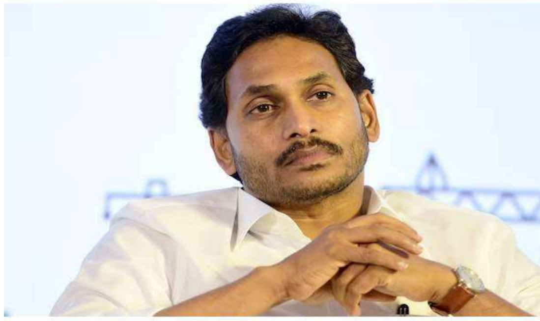
విజయవాడ, కోస్తా లీడర్ ప్రతినిధి : 2019లో వైఎస్ జగన్మోహన్ రెడ్డి నేతృత్వంలోని వైఎస్సార్ కాంగ్రెస్ పార్టీ (వైఎస్ఆర్ సీపీ) వాగ్దానాలు, అంచనాల వర్షం కొనసాగిస్తూ అధికారంలోకి వచ్చింది. 2019 ఎన్నికలకు ముందు, ఆంధ్రప్రదేశ్ కు "ప్రత్యేక హోదా" డిమాండ్ తో వైఎస్ఆర్ సీపీ ఎంపీలు ధైర్యంగా పార్లమెంటుకు రాజీనామా చేశారు.

వైఎస్ జగన్ ప్రత్యేక హోదా కోసం నిజంగా పోరాడతారా లేక ఆయన చేస్తున్న ప్రయత్నాలు కేవలం రాజకీయ వేషాలు మాత్రమేనా అన్నది ప్రశ్న. ఆయనపై ఉన్న అనేక అవినీతి కేసుల దృష్ట్యా, మోడీ ప్రభుత్వాన్ని ధీటుగా ఎదుర్కొనేందుకు ఆయన సిద్ధపడటంపై అనుమానాలు వ్యక్తమవుతున్నాయి. ఆంధ్రప్రదేశ్ కు ప్రత్యేక హోదా సాధించడం కంటే టీడీపీని అణగదొక్కడంపైనే ఎక్కువ దృష్టి సారించిన జగన్ తన పోరాటాన్ని చంద్రబాబు నాయుడుతో..!!!!