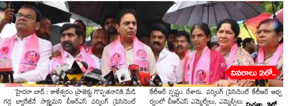
హైదరాబాద్ : కాశీశ్వరం ప్రాజెక్టు గొప్పతనానికి మేడిగడ్డ బ్యారేజీనే సాక్ష్యమని బీఆర్ఎస్ వర్కింగ్ ప్రెసిడెంట్ కేటీఆర్ స్పష్టం చేశారు. వర్కింగ్ ప్రెసిడెంట్ కేటీఆర్ ఆధ్వర్యంలో బీఆర్ఎస్ ఎమ్మెల్యేలు, ఎమ్మెల్సీలు విగత..2లో