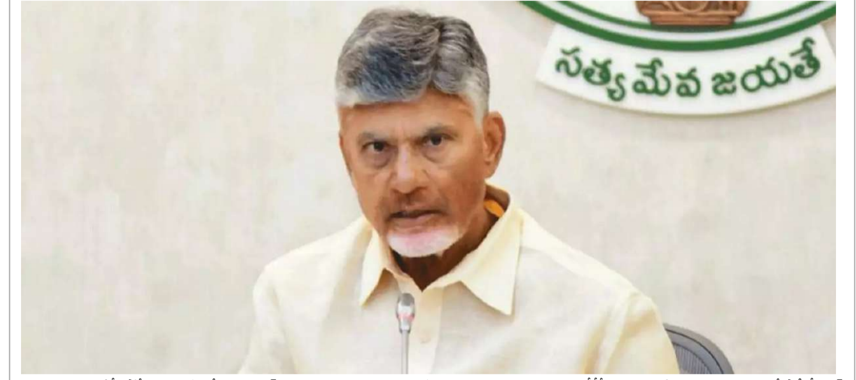
అమరావతి : ఏపీ పోలీసులు సంగం నేతలు యూటర్న్స్ వ్యవహారించామని.. తమను క్షమించాలని చంద్రబాబును వారు తీడిపీ కార్యాలయానికి వచ్చారు. ఈ సమయంలో పార్టీ సీనియర్ తీసుకున్నారు. గతంలో వైసీపీ సర్కారు చెప్పినట్టు వేడుకున్నారు. తాజాగా ఏపీ పోలీసు అధికారుల సంఘం నేతలు నాయకులు మాత్రమే ఉన్నారు. ఈ సమయంలో విగత..2లో