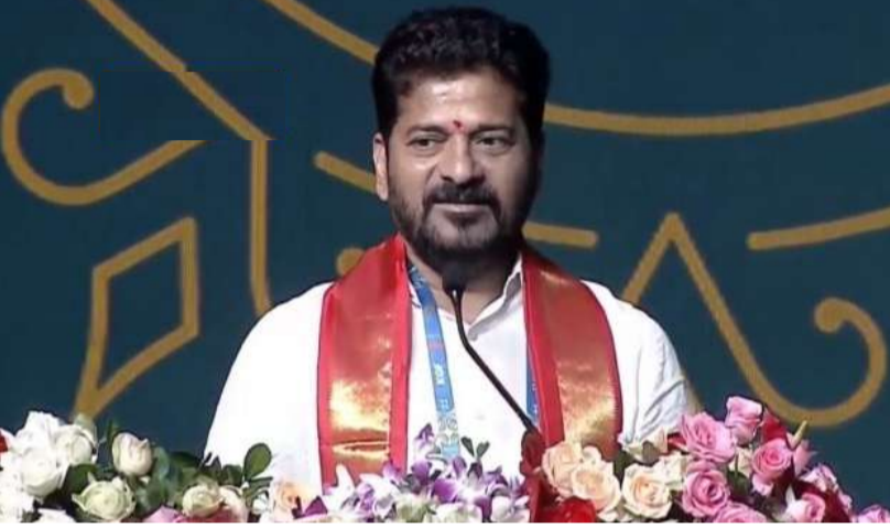
హైదరాబాద్ : రాజకీయాలు, లీడర్షిప్ లో ఉన్నానంటే ఆయన కూడా ఒక కారణమని ఎన్టీఆర్ ఒక బ్రాండ్ అని... తాను ఈ స్థాయిలో తెలంగాణ ముఖ్యమంత్రి రేవంత్ రెడ్డి అన్నారు.