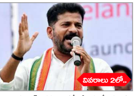
హైదరాబాద్: పన్నులు కట్టే ప్రాంతంలో ప్రజలకు నిరసన తెలిపే హక్కు ఉంటుంది, నిరసనలను అణచివేస్తే ఫలితాలు ఎలా ఉంటాయో డిసెంబర్ 3, 2023