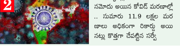
న్యూఢిల్లీ: భారత్ లో 2020లో నమోదైన అయిన కోవిడ్ మరణాల్లో సుమారు 11.9 లక్షల మరణాలు అధికంగా రికార్డు అయిన నల్ల కొత్తగా చేపట్టిన సర్వే