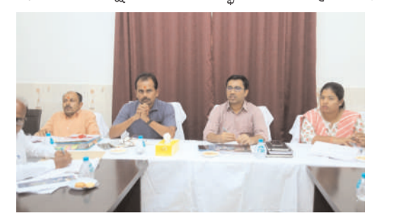
శ్రీ సమృద్ధి సారలమ్మ దేవాలయం ప్రాంగణం లో చేపట్టవలసిన