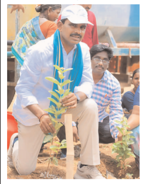
నాగర్ కర్నూల్ వనపర్తి బ్యారో(గోతమ్ న్యూస్): వన మహాత్మ్యం అభివృద్ధికి భాగంగా నాటి ప్రతి మొక్కను పసిపిల్లలలా కాపాడుకోవాలని, లక్షల సంఖ్యలో మొక్కలు నాటడంపై