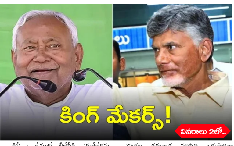
కింగ్ మేకర్స్! వివరాలు 2లో..

కేవలం 240 సీట్లతో మ్యూజిక్ ఫిగర్ కు దూరంగా నిలిచిన బీజేపీ ప్రభుత్వ ఏర్పాటుకు కీలకంగా మారిన ఎన్డీయే భాగస్వాములు చంద్రబాబు, నితీష్ కుమార్ ఇండియా కూటమి నేతలు టీడీపీ, జేడీయూతో టచ్ లో ఉన్నారన్న వార్తలతో కలకలం తాము ఎన్డీయేతోనే ప్రయాణిస్తామన్న నారా లోకేశ్