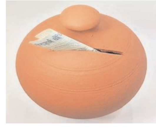
ఎకరాకు రాష్ట్ర ప్రభుత్వం చెల్లిస్తున్న రైతు భరోసా మందిగానే కేంద్ర

ఒక ఎరువుల బస్తా కూడా రెండు వేలకు రావడంలేదని రైతులు అంటున్నారు, పెరుగుతున్న ధరలకు అనుకూలంగా రైతులకు