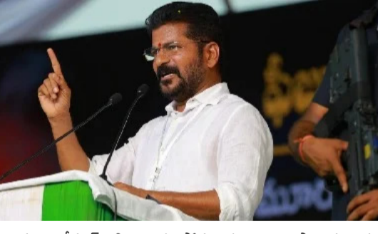
25 ముఖ్యమంత్రి రేవంత్ రెడ్డి ఆన్నారు. సోమవారం హైదరాబాదులోని రవీంద్రభారతిలో చందేమాతరం ఫౌండేషన్ ఆధ్వర్యంలో నిర్వహించిన పడో తరగతి ప్రభుత్వ పాఠశాల టాపర్ విద్యార్థుల సన్మాన కార్యక్రమానికి సీఎం ముఖ్య అతిథిగా హాజరయ్యారు. ఈ సందర్భంగా

చందేమాతరం ఫౌండేషన్ ఆధ్వర్యంలో నిర్వహించిన కార్యక్రమంలో పాల్గొన్న సీఎం చందేమాతరం ఫౌండేషన్ ప్రభుత్వ పాఠశాలలను ప్రోత్సహిస్తోందని ప్రశంస ఒక్కో విద్యార్థిపై ప్రభుత్వం రూ.80వేలు ఖర్చు చేస్తాందన్న ముఖ్యమంత్రి హైదరాబాద్ : డీఎస్సీ ద్వారా త్వరలో టీచర్ పోస్టులను భర్తీ చేస్తామని తెలంగాణ