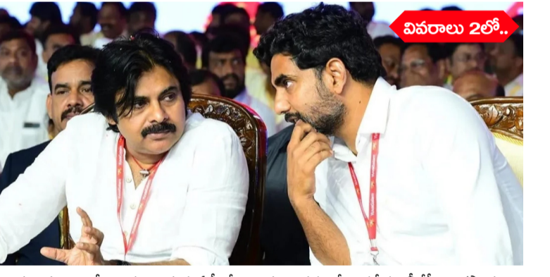
25 అమరావతి : భారీ అంచనాల మధ్య ఏపీలో మంత్రివర్గంలో జనసేన, బీజేపీ భాగస్వాములు కొత్త ప్రభుత్వం కొలువు తీరుతుంది. చంద్రబాబు కానున్నాయి. కొద్ది రోజులుగా..26