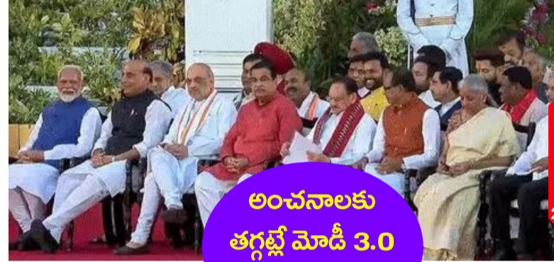
25 ధీల్లీ : అంచనాలకు తగ్గట్టే మోడీ 3.0 కొలువు తీరింది. ప్రమాణస్వీకార మహోత్సవం పూర్తి. ప్రధానిగా సరేంద్ర్..26

అసక్తికర ఐదు అంశాల్ని చూస్తే.. టాప్ 10 మెజార్స్ నేతల్లో నలుగురికి మంత్రిపదవులు సార్వత్రిక ఎన్నికల్లో అత్యధిక మెజార్స్ సాధించిన టాప్ 10 మంది ఎంపీల్లో నలుగురికి తాజాగా కేంద్ర మంత్రి పదవులు దక్కాయి. అసక్తికరమైన అంచనం ఏమంటే.. ఈసారి ఎన్నికల్లో 400 ప్లస్ సీట్ల టార్గెట్ పెట్టుకోవటం..