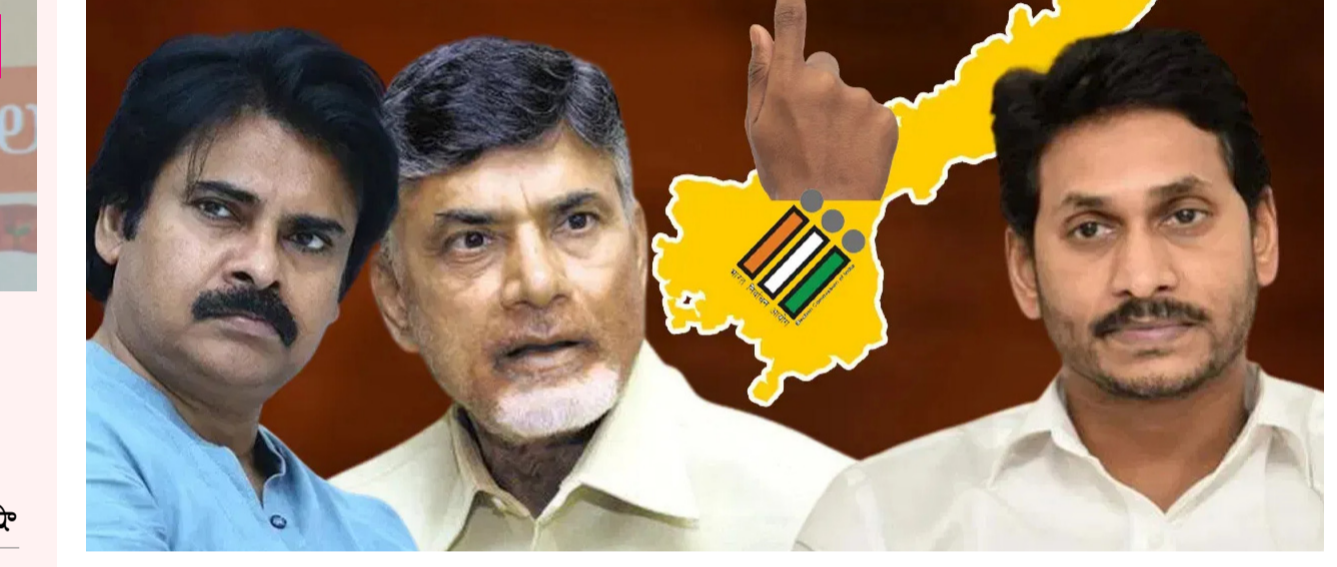
అమరావతి : ఏపీలో ఎన్నికల సమరం హెబారా హెబారీగా మారింది. ప్రధాన పార్టీల అధినేతలు ప్రచారం చేగం పెంచారు. నేటి నుంచి నామినేషన్లు పెడుతున్నారు. గెలుపు పై ప్రధాన పార్టీల నేతల ధీమా వ్యక్తం చేస్తున్నారు. షిగతా 2లో..