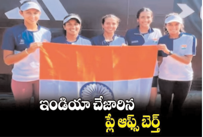
ఇండియా చేజాలిన ఫ్లై ఆఫ్స్ బెర్డ్

చాన్సా (చైనా): ప్రతిష్టాత్మక బిల్డి జీన్ కింగ్ కమ్ ఆసియా-ఓషియానియా టోర్నమెంట్ లో ఫ్లై ఆఫ్స్ చేరి చరిత్ర సృష్టించే సమర్థవంతంగా ఇండియా విమెన్స్ టెన్సిస్ టీమ్ కౌంట్రీ చేజాలింది.