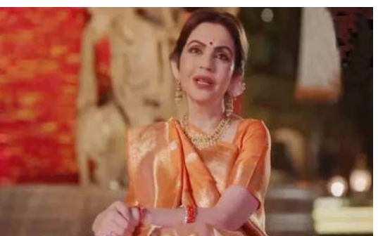
తాము కోరుకున్నట్లు వివరించారు. ముందస్తు వివాహ వేడుకలకు ఆహ్వానాలు అందిన వారిలో బాలీవుడ్ ప్రముఖులు అమితాబ్ బచ్చన్, షారుక్ ఖాన్ సహా క్రికెట్ దిగ్గజాలు సచిన్ టెండూల్కర్, ఎంఎస్ ధోనీ ఉన్నారు. వ్యాపార దిగ్గజాల్లో మెట్రా సీఈఓ మార్క్ జాకర్బర్గ్, మైక్రోసాఫ్ట్ వ్యవస్థాపకుడు బిల్ గేట్స్, ఆల్ఫాబెట్ సీఈఓ సుందర్ పిచాయ్, అడ్డోబ్ సీఈఓ శంతను నారాయణ్,