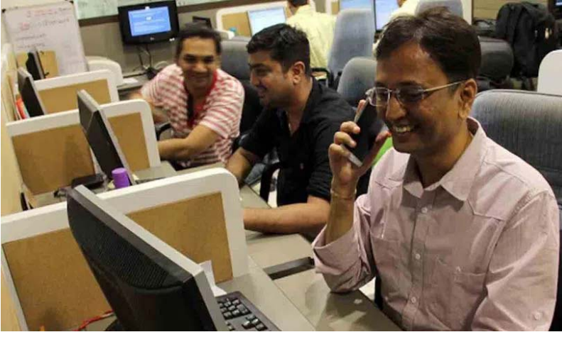
సంస్థాగత ఇన్వెస్టర్లు రూ.230 కోట్ల విలువైన షేర్లు విక్రయించారు. గత నెలలో ఇండియన్ ఈక్విటీలో విదేశీ ఇన్వెస్టర్లు రూ.5,107 కోట్ల షేర్లు కొనుగోలు చేశారు.

న్యూఢిల్లీ: దేశీయ స్టాక్ మార్కెట్లు బీఎస్ఈ-30 ఇండెక్స్ సెన్సెక్స్, ఎన్ఎస్ఈ-50 సూచీ నిష్ట శుక్రవారం సరికొత్త రికార్డులు నెలకొల్పాయి. దేశీయ ఆర్థిక వృద్ధిరేటు ఊహించిన దానికన్నా మెరుగ్గా పుంజుకోవడం, అమెరికా డ్రవ్వోల్టేజీ అంచనాలకు అనుగుణంగా ఉండటంతో ఇన్వెస్టర్లలో సెంటిమెంట్ బలపడింది. దీంతో బ్లాచిప్ ఇండెక్స్ ఎన్ఎస్ఈ నిష్ట-50.. 356 పాయింట్లు (1.6శాతం) పెరిగి 22,339 పాయింట్ల వద్ద, బీఎస్ఈ-30 సూచీ సెన్సెక్స్ 1245 (1.72శాతం) పాయింట్లు పుంజుకని 73,745 పాయింట్ల వద్ద ముగిసింది. దీంతో బీఎస్ఈ లిస్టెడ్ కంపెనీల మార్కెట్ క్యాపిటలైజేషన్ రూ.4.16 లక్షల కోట్లు పెరిగి రూ.392.11 లక్షల కోట్లకు చేరుకున్నది. ఐటీ మినహా మిడియా, ఫార్మా అండ్ హెల్త్ కేర్ మినహా అన్ని సెక్టర్లలో ఇండెక్సులు లాభాల్లో ముగిసాయి. నిష్ట బ్యాంకు, ఆటో, ఫైనాన్సియల్ సర్వీసెస్, మెటల్, ఆయిల్ అండ్ గ్యాస్ ఇండెక్సులు రెండు శాతానికి పైగా లాభ పడ్డాయి. స్మార్ట్ అండ్ మిడ్ క్యాపి ఇండెక్స్ లు దాదాపు ఒక శాతం చొప్పున లాభ పడ్డాయి. ఇండెక్సులు పుంజుకోవడానికి కారణాలివి.. అక్టోబర్-డిసెంబర్ త్రైమాసికంలో భారత వృద్ధిరేటు 8.4 శాతానికి పెంచుకున్నది. గత ఆరు త్రైమాసికాల్లో శరవేగంగా సాధించిన ప్రగతి ఇది. మాన్యుఫ్యాక్చరింగ్, నిర్మాణ రంగ కార్యకలాపాల పుంజుకోవడం కలిసి వచ్చింది. జూన్ నెలలో అమెరికా ఫెడ్ రిజర్వు యూరోపియన్ యూనియన్ సెంట్రల్ బ్యాంక్ రుణ ఖర్చులు తగ్గించడంతో యూరోప్ స్టాక్స్ 600 పాయింట్లు పుంజుకున్నది. జపాన్ నిష్ట 1.9 శాతం పెరిగి తాజా ఆల్ టైం గరిష్టానికి చేరుకున్నాయి. గురువారం విదేశీ సంస్థాగత ఇన్వెస్టర్లు రూ.3,568 కోట్ల విలువైన షేర్లు కొనుగోలు చేసి, దేశీయ