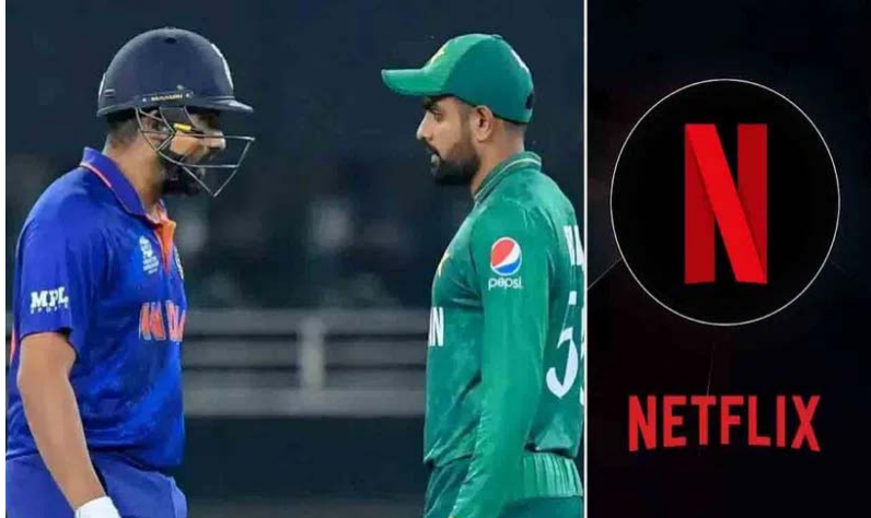
మ్యాచ్లో వీరోచిత ఇన్నింగ్స్తో ఆడిన విరాట్ కోహ్లి ఒంటి చేత్తో పాక్ను ఓడించాడు.

ప్రపంచ క్రికెట్లో భారత్ పాకిస్తాన్ మ్యాచ్కు ఉండే క్రేజ్ వేరు. చిరకాల ప్రత్యర్థిలైన ఇండియా, పాక్లు మైదానంలో తలపడుతున్నాయంటే స్టేడియాలు కిక్కిరిసిపోతాయి. బంతి బంతికి ప్రేక్షకుల్లో నరాలు తెగత ఉత్సాహం కనిపిస్తోంది. అందుకనే క్రికెట్లోని గొప్ప సమరాలలో భారత్, పాకిస్తాన్ మ్యాచ్ ఒకటిగా పేరొందింది. అయితే.. ఇరుదేశాల మధ్య ధైర్యాత్మక సంబంధాల సరిగ్గా లేని కారణంగా భారత్, పాక్లు ఐసీసీ ట్రోఫీ మాత్రమే పోటీపడుతున్నాయి. ఈ నేపథ్యంలో ప్రముఖ ఓ.టి.టీ ఫ్లాట్ఫామ్ నెట్ఫ్లిక్స్ అభిమానులకు గుడ్ న్యూస్ చెప్పింది. ఇండో పాక్ జట్ల మధ్య ఉన్న క్రికెట్ వైరంను డాక్యుమెంటరీగా రూపొందించింది. శుక్రవారం 'గ్రేట్స్ట్ రైవల్స్' పేరుతో చిత్రీకరించిన డాక్యుమెంటరీ ఫస్ట్ లుక్ను విడుదల చేసింది. 'లైట్స్, కెమెరా, క్లీన్ బొల్ట్. చరిత్రలో భాగమైన, గ్రేట్స్ట్ రైవల్స్ నెట్ఫ్లిక్స్లో త్వరలోనే రాబోతోంది' అనే క్యాప్షన్తో ఉన్న ఆ వీడియో ఆన్లైన్లో వైరల్ అవుతోంది. నిరుడు అనియా కమ్, వన్డే వరల్డ్ కప్లో భారత్, పాకిస్తాన్లు తలపడ్డాయి. అయితే.. ఈ రెండు టోర్నీలోనూ దాయది జట్టును టీమిండియా చిత్తుగా ఓడించింది. మళ్లీ టీ20 ప్రపంచ కప్లో భారత్, పాక్లు అమీతుమీ తేల్చుకోనున్నాయి. వెస్టిండీస్, అమెరికా సంయుక్తంగా ఆతి ధ్యమిస్తున్న ఈ మోగా టోర్నీ జూన్ 1వ తేదీన ఘరూ కానుంది. జూన్ 9వ తేదీన న్యూయార్క్ వేదికగా ఇండియా, పాకిస్తాన్ మ్యాచ్ జరుగుతుంది. టీమిండియాదే పైచేయి అంటే ట్రోఫీలో భారత్, పాకిస్తాన్ తలపడడం ఇది ఎనిమిదో సారి. గత ఏడు పర్యాయాలు దాయదిపై టీమిండియా పైచేయి సాధించింది. ఇప్పటివరకూ భారత జట్టు ఆరుసార్లు విజేతగా నిలిచింది. 2007 టీ20 ప్రపంచ కప్ ఫైన్లో ధోనీ సేన పాక్ను చిత్తు చేసింది. 2022 పాల్లీ ప్రపంచకప్లో మెల్బోర్న్లో జరిగిన