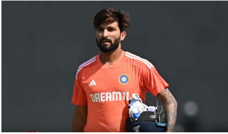
1తో గెలుచుకున్న భారత్.. ఈనెల 7 నుంచి ధర్మశాల వేదికగా ఆఖరి టెస్టు ఆడనుంది. ఈనెల 2 తర్వాత భారత జట్టు ధర్మశాలకు వెళ్లే అవకాశముంది.

ఇంగ్లండ్తో వైతాక్ వేదికగా జరిగిన రెండో టెస్టులో ఎంట్రీ ఇచ్చి ఆ మ్యాచ్లో తొలి ఇన్నింగ్స్లో కాస్త చెప్పుకోదగ్గ ఇన్నింగ్స్ ఆడిన టీమిండియా మిడిలార్డర్ బ్యాటర్ రజత్ పాటిదార్ ఆ తర్వాత వరుసగా ఐదు ఇన్నింగ్స్లో డబుల్ డిజిట్ చేరడానికి నానా తంటాలు పడుతున్నాడు. దేశవాళీ క్రికెట్లో పాటు భారత్ 'ఏ'కు ఆడిన క్రమంలో బన్నుల కొద్దీ పరగులు చేసి సెలక్షన్ రృష్టిలో పడిన పాటిదార్.. జాతీయ జట్టులో మాత్రం ఆ మ్యాజిక్ను రిపీట్ చేయలేకపోతున్నాడు. వరుస వైఫల్యాలతో మూడు టెస్టులలో 63 పరుగులే చేసిన పాటిదార్ను ధర్మశాల టెస్టులో పక్కనబెట్టి దేవ్దత్ పడిక్కులకు ఛాన్స్ ఇవ్వనున్నట్లు వార్తలు వస్తున్న నేపథ్యంలో దక్షిణాఫ్రికా దిగ్గజం ఏబీ డివిలియర్స్.. పాటిదార్కు మద్దతుగా నిలిచాడు. డివిలియర్స్ తన యూట్యూబ్ ఛానెల్ వేదికగా స్పందిస్తూ 'రజత్ పాటిదార్ ఈ సిరీస్ (ఇంగ్లండ్)లో లైఫ్ టైమ్ గుర్తుంచుకునే ఇన్నింగ్స్లు ఆడలేడు. కానీ ప్రస్తుతం భారత జట్టులో ఉన్న మంచి విషయం ఏంటంటే కొన్నిసార్లు మనం బాగా ఆడకున్నా ఫలితాలు జట్టుకు అనుకూలంగా వస్తున్నప్పుడు టీమ్లో కొనసాగాళ్ళు, పాటిదార్ అంటిట్యూట్ బాగా ఉంది అతడి క్యారెక్టర్ డ్రెస్సింగ్ రూమ్లో అందరికీ నచ్చితే కెప్టెన్ రోహిత్ శర్మ అతడు టీమ్లో ఉండాలని సెలక్షన్లకు కోరాళ్ళు. ఈ కుర్రాడికి మంచి భవిష్యత్ ఉంది. ప్రస్తుతానికి అతడు పరుగులేమీ చేయకున్నా అతడికి మరెన్ని అవకాశాలిచ్చి చూడండి..' అని అభిప్రాయపడ్డాడు. ప్రస్తుతం భారత జట్టులో కుర్రాళ్లు అంచనాలకు మించి రాణిస్తున్నారని డివిలియర్స్ కొనియాడాడు. జట్టులోకి వచ్చే అటగాళ్లు పాజిటివ్ అంటిట్యూట్లో ఉన్నారని, వాళ్లకు వచ్చిన అవకాశాలను సద్వినియోగం చేసుకుంటున్నారని మిస్టర్ 360 అన్నాడు. ఇదిలాఉండగా ఐదు మ్యాచ్ల సిరీస్ను ఇప్పటికే 3-